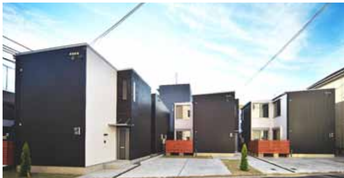
キューブ型のシンプルで洗練された外観が特徴。