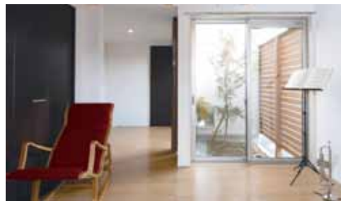
ウッドデッキから光と風を取り入れる、明るく開放的なプラン例。

賃貸住宅「ユニキューブ」 による土地活用。27坪以上 の土地に1棟800万円、建 築でき、7～8年の短期間 で投資回収が可能。また、 2棟1セットで建築する ため、1棟は賃料収入を 得ながら、もう1棟を自宅 とすることも。さらに、将来 は二世帯住宅とするなどオ ナー様様のライフスタイル の変化に合わせて幅広く活 用できるのも魅力です。