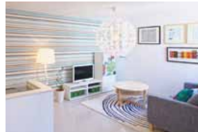
入居者ニーズに合わせた、間取りやデザインプランをご提案。

リッシュな外観と高い居住性を備えているため、家賃崩れの心配もありません。初期投資を抑えながら、高入居率、高利回りを実現する新しい土地活用。ぜひ、前向きにご検討ください。 (記載の価格は全て税別です)